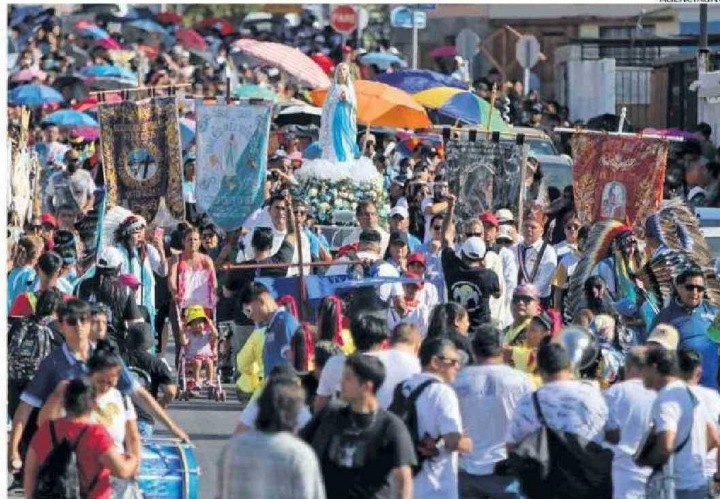
LOS FIELES SE REENCENTRARON UNA VEZ MÁS CON LA VIRGEN DE LOURDES.

“Nosotros como Tinku pertenecemos más menos del año del 2003 y es un baile andino que vino a formar parte de la