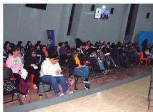
Personas presenciaron y fueron partícipes de la Obra de Teatro LOS MAZALEZ en Iquique.