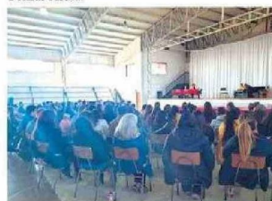
Personas presenciaron y fueron partícipes de la Obra de Teatro LOS MAZALEZ en La Serena.