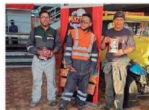
Personas presenciaron y fueron partícipes de la Obra de Teatro LOS MAZALEZ en Calama.