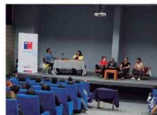
Personas presenciaron y fueron partícipes de la Obra de Teatro LOS MAZALEZ en UTA Arica.