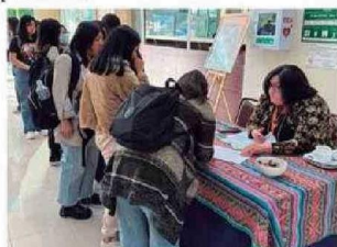
Personas presenciaron y fueron partícipes de la Obra de Teatro LOS MAZALEZ en CFT Arica.