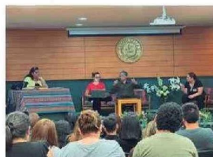
Personas presenciaron y fueron partícipes de la Obra de Teatro LOS MAZALEZ en Santo Tomás Arica.