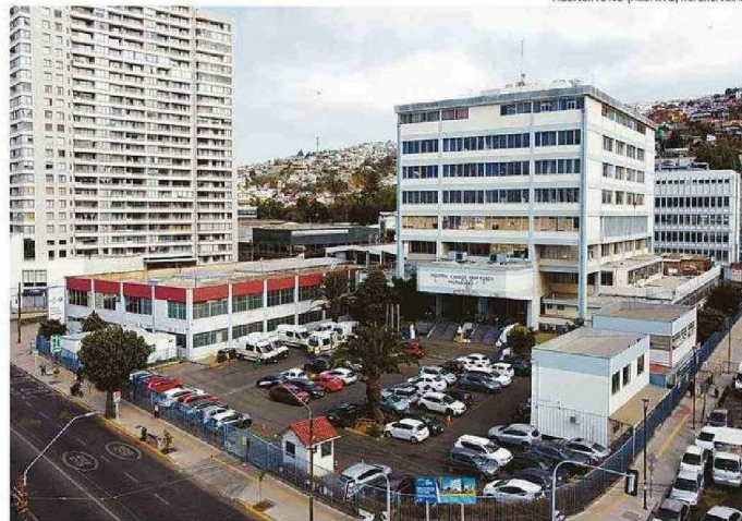
UNIDAD ESTARÍA FUNCIONANDO “AL MÍNIMO” GRACIAS A LAS HORAS DE DOCENTES UNIVERSITARIOS.

ha estado trabajando incansablemente en reducir las listas de espera en consulta y cirugías, sin embargo, con la cantidad de pacientes en espera —más de 4.600— y solo con 11 especialistas, la mayoría de ellos con contratos por 11 horas semanales, con equipamiento obsoleto o en malas condiciones, y con los incumplimientos de las garantías