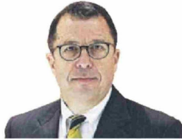
Por Sebastián Edwards