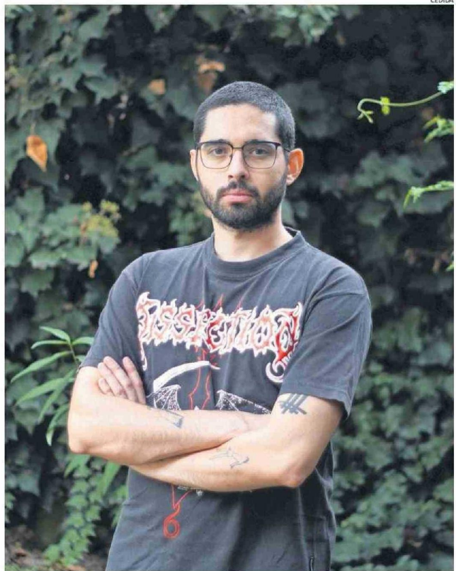
"ME PARECIÓ UN DEBER PUBLICAR ALGO PARA QUE SE HABLE DEL TEMA" SALUD MENTAL, DICE EL AUTOR.

— Afortunadamente soy independiente, no tengo que darle explicaciones a nadie y para mí es un tema súper importante: así como hay gente que tiene la bandera de lucha de los pueblos indígenas u otra causa, mi bandera es la salud mental, y tengo el privilegio de que se me da la escritura, que sé mucho del tema y me pareció más bien un deber publicar algo para que se hable del tema. (Aunque) a veces hablan mucho, pero no ha-