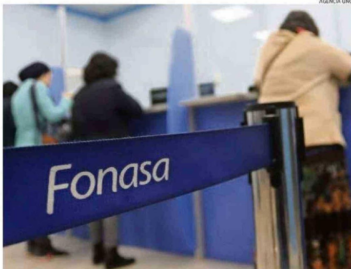
EN SEPTIEMBRE DE 2022 SE PUSO EN MARCHA LA INICIATIVA.

nuestros usuarios, que principalmente se atienden en los hospitales de mayor complejidad, tengan gratuidad total en aquellas prestaciones que son sobre todo de mayor cuantía. Tanto los usuarios que son Fonasa C, como Fonasa D, hasta la fecha podemos decir que