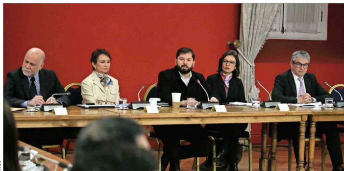
“Sabemos que (la reforma de pensiones) es una urgencia para la gran mayoría de los chilenos y chilenas, aunque algunos parecieran querer negarlo”, dijo Boric en el encuentro.

Pese a un mal resultado en el Imacec de mayo, el mandatario habló de que en Chile surgen los brotes verdes. Desde Chile Vamos criticaron que falta claridad respecto del proyecto de pensiones.