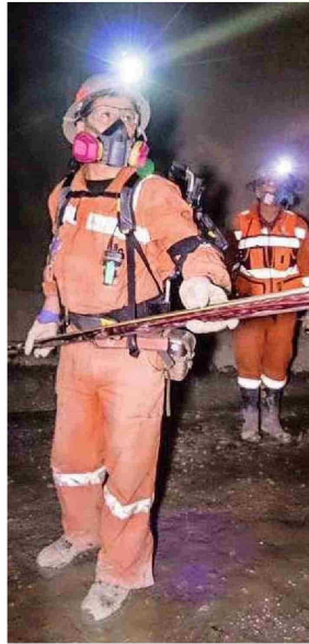
El 2023, Codelco El Teniente realizó un plan piloto con uso de exoesqueletos.

En la planta de molibdeno de Teck se generan gases de ácido sulfhídrico, que son inodoros y letales sin detección adecuada. Por ello, se han instalado sensores que avisan alarmas al detectar el gas, obligando a evacuar. Además, hay respiradores ubicados estratégicamente, y cada trabajador lleva un dispositivo personal que detecta el gas y emite una alerta para retirarse de inmediato.