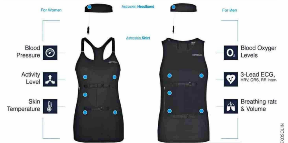
Los sensores en el vestuario detectan, por ejemplo, si una persona se cae.

Un ejemplo en Chile es el de Codelco División El Teniente, donde los trabajadores deben llevar un tag que contiene sus datos personales y permite su localización precisa mediante antenas en la mina. Este sistema facilita la identificación de la ubicación de las personas, especialmente durante emergencias, y también monitorea el movimiento de vehículos y apoya en evacuaciones con control en tiempo real.