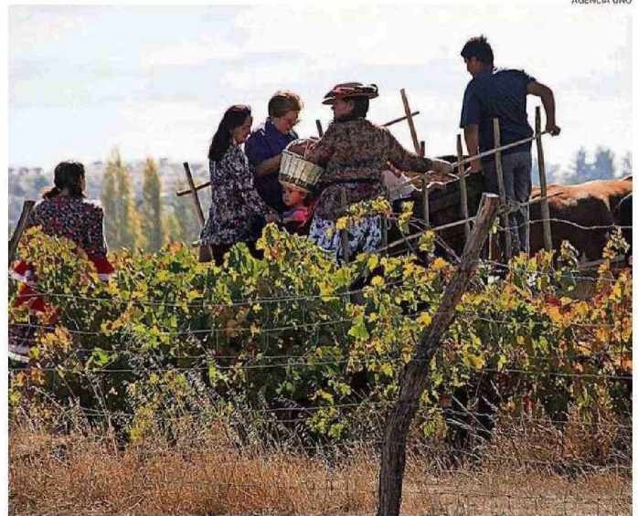
ASPECTOS MÁS RELEVADOS POR GREMIOS FUE LA NECESIDAD DE ROBUSTECER MATRIZ ENERGÉTICA.

dicadores propios, nos dimos cuenta que era así, y hoy estamos en el último lugar de la tabla. Ñuble tiene muchas fortalezas, pero también deficiencias, principalmente en agua, energía, red vial, digital, y conectividad aérea, y todos están conscientes, el mundo privado, político, todos estamos