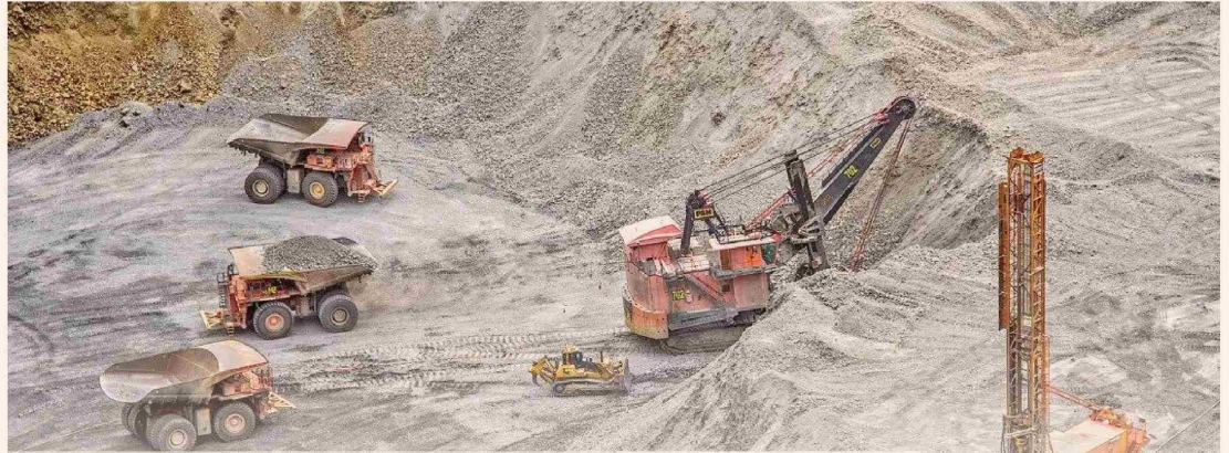
Las mayores transacciones cupríferas 2013-2024