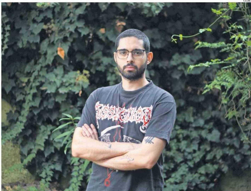
“ME PARECIÓ MÁS BIEN UN DEBER PUBLICAR ALGO PARA QUE SE HABLE DEL TEMA” DE LA SALUD MENTAL, DICE EL AUTOR.

—Todo el mundo, los psiquiatras, los cuidadores, los enfer-