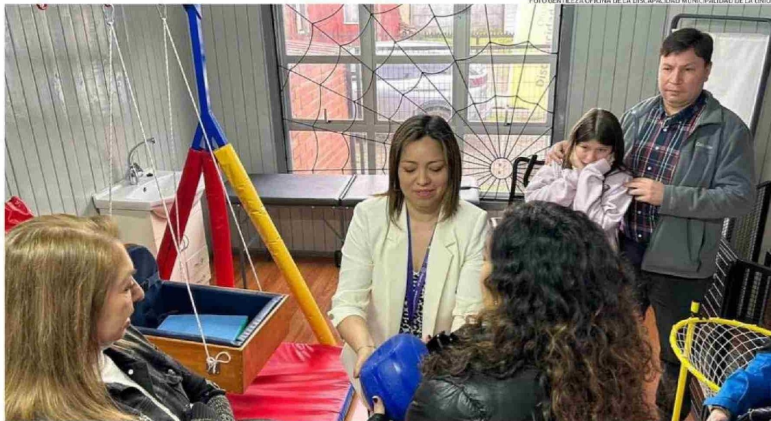
EL CENTRO DE REHABILITACIÓN INFANTIL DE LA UNIÓN ENTREGA TRATAMIENTO A NIÑOS DESDE LOS MESES DE VIDA EN ADELANTE, HASTA LOS 18 AÑOS DE EDAD.

Mientras que sobre el equipo de profesionales, el encargado de la Oficina de la Discapaci-