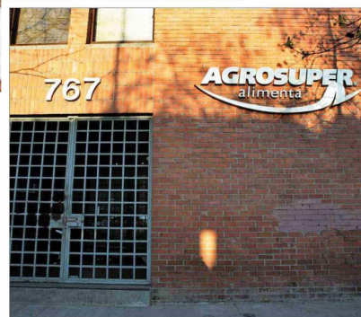
Agrosuper es el mayor productor de proteínas del país.

“Nuestra idea es recuperar nuestro crecimiento en el futuro (...) Queremos asegurarnos de que nuestra posición financiera es fuerte, así que vamos a ver lo que pasa en la segunda mitad del año en términos de uso de caja, para eventualmente reducir deuda o mejorar nuestra posición financiera”, señaló la firma a inversionistas. Agregaron: “Nuestro crecimiento estará concentrado en pollo y en salmón”. En ambos productos aumentarán su capacidad productiva.