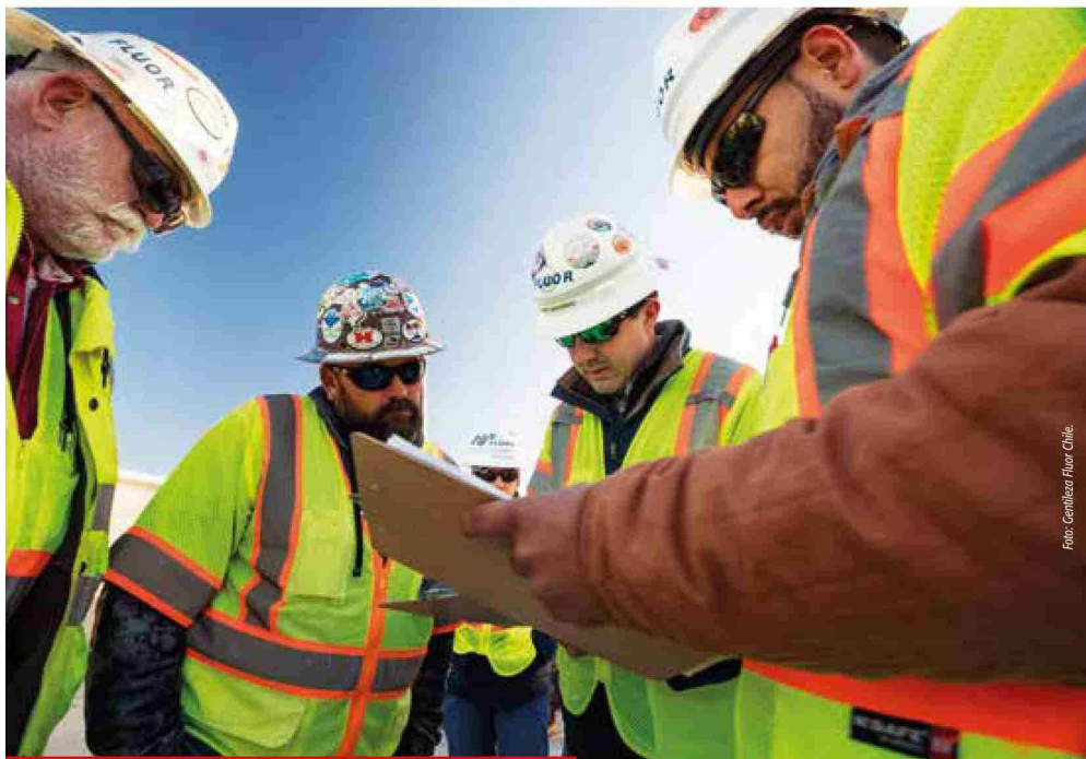
Un aspecto relevante es la conformación de los equipos de trabajo.

tas es la creencia de que para garantizar su mantenibilidad y facilidad de operación se requieren grandes edificios con amplios espacios e infraestructura significativa. Sin embargo, la mantenibilidad y la operatividad forman parte integral del diseño y no necesariamente están vinculadas a estructuras de gran tamaño o alto costo".