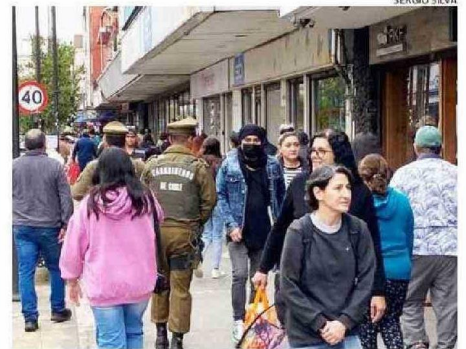
CARABINEROS REFORZÓ LA SEGURIDAD EN EL CENTRO POR NAVIDAD.

“Hemos comenzado con el plan ‘Navidad Segura’ y se han dispuesto servicios reforzados en Ramírez, Errázuriz y Lynch,