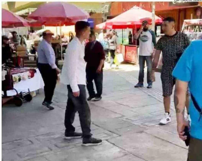
EN LA IMAGEN APARECEN LOS DOS SUJETOS QUE PELEARON CON CUCHILLO, CON TRANSEÚNTES ALREDEDOR.

torniquete porque estaba sangrando. Fue una pelea que a todos nos sorprendió. Yo iba por un trámite a la empresa de celulares de la esquina y me encontré con esta escena terrible. Es una situación complicada lo que está pasando en la ciudad en cuanto a la seguridad. Sería bueno mayor presencia policial en este sector”, manifestó la locataria, quien pidió reserva de su identidad por temor a represalias de los hampones que pululan por el barrio.