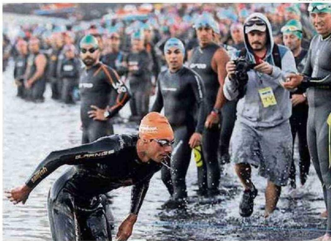
LA EXIGENTE PRUEBA CONTEMPLA 1.900 METROS DE NATACIÓN EN LAS AGUAS DEL LAGO DE VILLARRICA.

Debido a la creciente preocupación por la contaminación del lago Villarrica, durante los días previos se ha aumentado la frecuencia del muestreo de las aguas para advertir la posible presencia de microcistina, lo que hasta ahora no ha ocurrido. "Nosotros comenzamos el monitoreo el día 13 de diciembre y se extenderá hasta el 15 de marzo. A la fecha no hemos encontrado hallazgos de microcistina porque para que haya tiene que producirse previamente el fenómeno de bloom de algas y eso no ha ocurrido hasta el momento", indicó el seremi de Salud, Andrés Cuyul Soto, quien entregó tranquilidad a quienes mañana se enfrentarán al lago