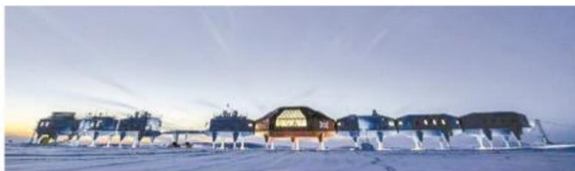
Halley VI en la Antártica.

con sus estudios y observaciones, descubrieron una gran amenaza que se cierne sobre nuestro planeta, el gran agujero abierto en la capa de ozono de la estratosfera terrestre. Durante el invierno de 1986 el cielo lució un borrón blanquecino, una especie de bola de nieve lanzada con fuerza contra el firmamento nocturno, se trataba del cometa Halley. El último paso por el perihelio del cometa Halley se produjo el 9 de febrero de 1986 y el próximo se producirá el 28 de julio de 2061.