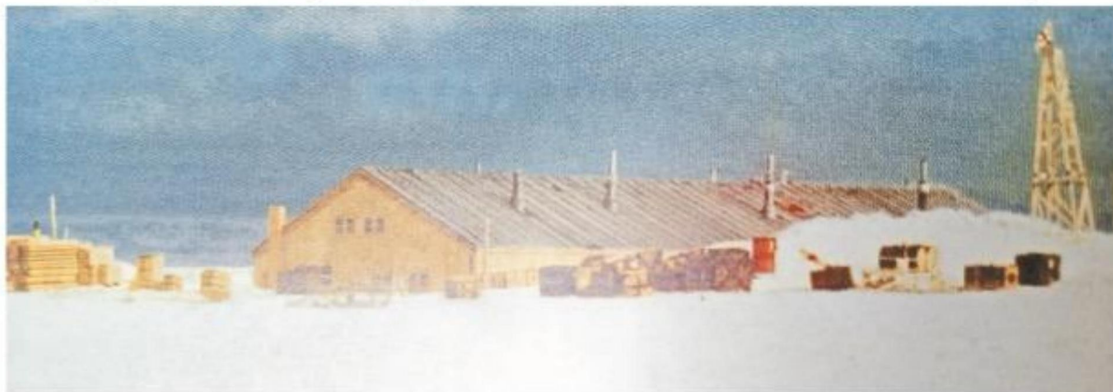
Estación Antártica Halley en 1956.

En el segundo viaje científico educativo del HMS Paramour el 24 de agosto de 1699, que volvió a navegar en septiembre de 1699 para hacer extensas observaciones sobre las condiciones del magnetismo terrestre. Tránsito marítimamente en el año 1700 por el estrecho de Magallanes, Falkland Island hasta el 6 de septiembre de 1700 se extendió desde 52 grados norte a 52 grados sur en las islas Georgias del Sur, un archipiélago del conjunto denominado Antartillas ubicados en los 54° grados sur, en el sector antártico. Como los barómetros ordinarios no servían en el mar por el movimiento del barco, Halley llevó un barómetro marino en el HMS Paramour que tenía inscripciones tales como lluvia, variable, muy seco, con determinadas alturas de la columna de mercurio, una combinación de termómetro de aire y alcohol, ideado por Robert Hooke. Este profesor, es uno de los líderes de la ciencia. Por ejemplo, en mecánica, donde la ley de la elasticidad que hoy lleva su nombre se sigue usando, pero además en tecnología o ingeniería. También fueron importantes sus contribuciones en óptica y en el diseño y mejora de telescopios y microscopios.