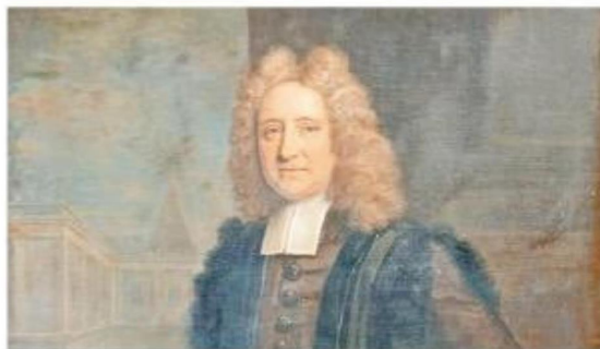
Edmund Halley fue un gran astrónomo, pero también destacó en otras materias científicas.

El 14 de enero de 1842 se cumplió el centenario de la muerte del gran famoso astrónomo. Ya en Siglo XX, en la misma fecha el 14 de enero de 1942 se cumplió el Bicentenario del fallecimiento del famoso académico científico. Una década después de esta conmemoración en el mismo siglo se hacen los preparativos para instalar en el continente antártico una estación