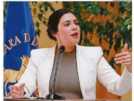
KAROL CARIOLA, PRESIDENTA DE LA CÁMARA DE DIPUTADOS.