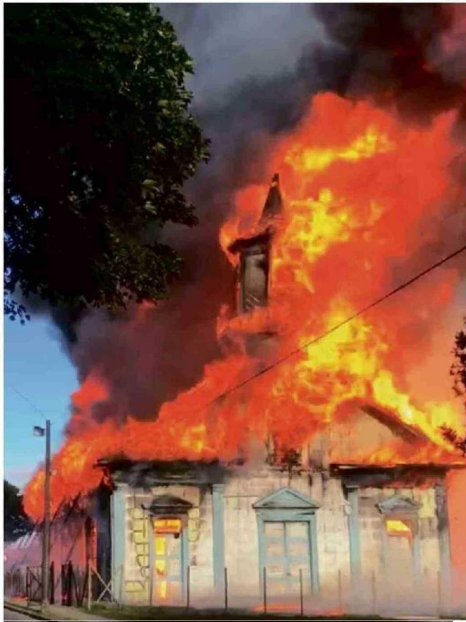
EL AÑO 2024 SE INICIÓ CON EL VORAZ INCENDIO QUE DESTRUYÓ POR COMPLETO LA IGLESIA DE CARELMAPU.

El año 2024 comenzó con la noticia del siniestro que el 16 de enero redujo a escombros y cenizas la iglesia de Carelmapu declarada Monumento Histórico en 1993. Desde entonces se iniciaron infructuosos esfuerzos destinados a lograr la restauración del templo cuya construcción data de 1913 y que permaneció en desuso en los