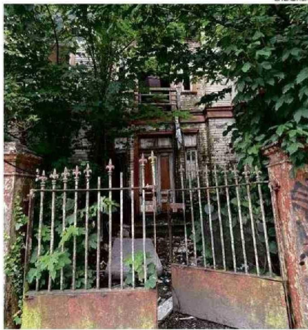
VANOS HAN SIDO LOS INTENTOS POR RESCATAR LA CASA FERNÁNDEZ.

El proyecto de restauración significó una inversión superior a los tres mil millones de pesos y fue financiado por la Subse-