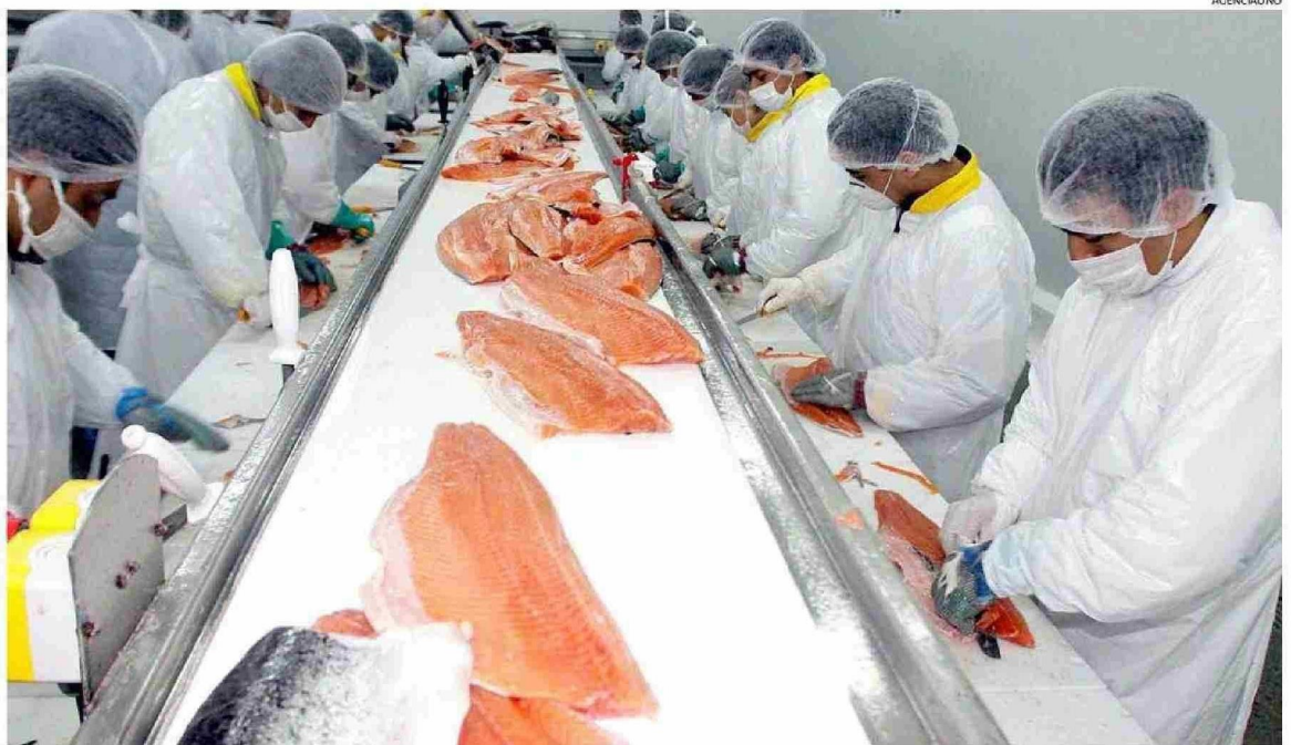
EL 94% DE LOS ENVÍOS A ESTADOS UNIDOS CORRESPONDE A SALMÓN FRESCO TRANSPORTADO POR VÍA AÉREA. ESTAS EXPORTACIONES ALCANZARON UN VALOR CIF DE US$4.125 MILLONES.

De ahí a que una de las preocupaciones radica en que un eventual aumento de precios del salmón en el mercado de Estados Unidos podría incentivar a los con-