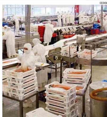
EL SALMÓN ES CLAVE PARA LA ECONOMÍA REGIONAL

"En momentos como este, es fundamental actuar con unidad, visión de largo plazo y foco en el bien común, para que sectores estratégicos que poseen una canasta exportadora importante para nuestra región como lo es la salmicultura, la mitilicultura, la agricultura, la ganadería, entre otros, puedan seguir desarrollándose, generando empleos y aportando al crecimiento sustentable de nuestra región", apuntó el secretario regional ministerial. ☺