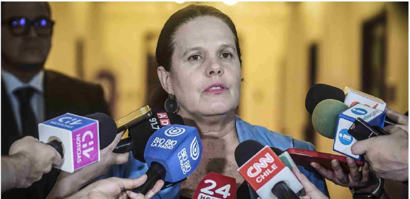
► Maya Fernández (PS), ministra de Defensa.

La secretaria de Estado socialista dio un punto de prensa, tras cuatro días en silencio, sobre la frustrada compra de la vivienda de su abuelo, Salvador Allende. Pese a que reconoció que el proceso no fue bien llevado y reiteró que todo lo dejó en manos del abogado de su familia, parlamentarios de la alianza de gobierno no quedaron conformes y profundizaron sus críticas.