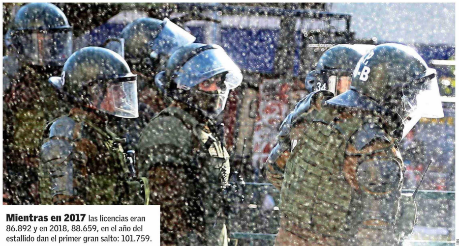
Mientras en 2017 las licencias eran 86.892 y en 2018, 88.659, en el año del estallido dan el primer gran salto: 101.759.