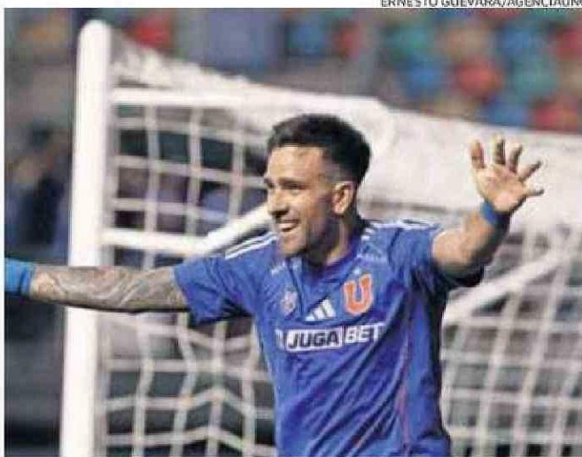
EL ZAGUERO NO QUIERE PERDERSE EL DUELO DEL LUNES.