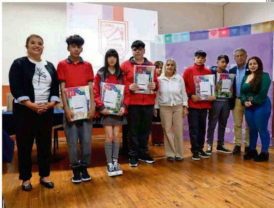
MÁS DE 66 MIL ALUMNOS DE LA REGIÓN SERÁN BENEFICIADOS CON PROGRAMA DE JUNAEB, QUE ENTEGA KITS ESCOLARES GRATIS.

La actividad se llevó a cabo en el Liceo Marta Brunet, uno de los 340 estable-