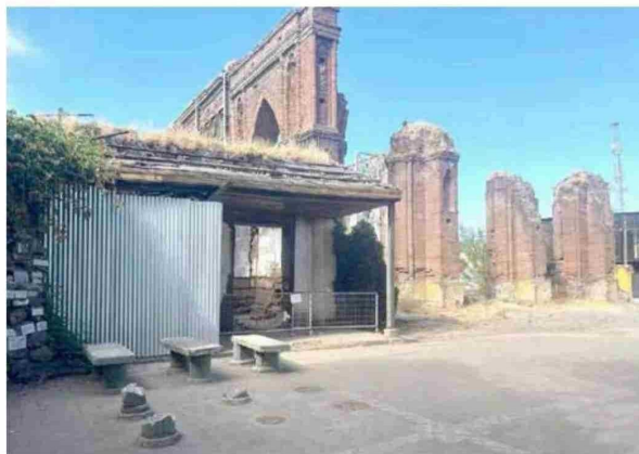
La Iglesia de San Francisco de Curicó, fue declarada Monumento Histórico en 1986.

Junto con reforzar la actual estructura, una idea que circula es complementar aquello con la habilitación de un museo. “(Sobre hacer una nueva iglesia) no hay empresas que quieran participar en una licitación de esa envergadura. Pero sí creo que es