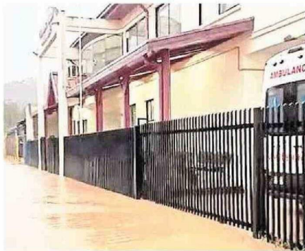
EL RECINTO LOTINO FUE INUNDADO POR LAS FUERTES LLUVIAS.