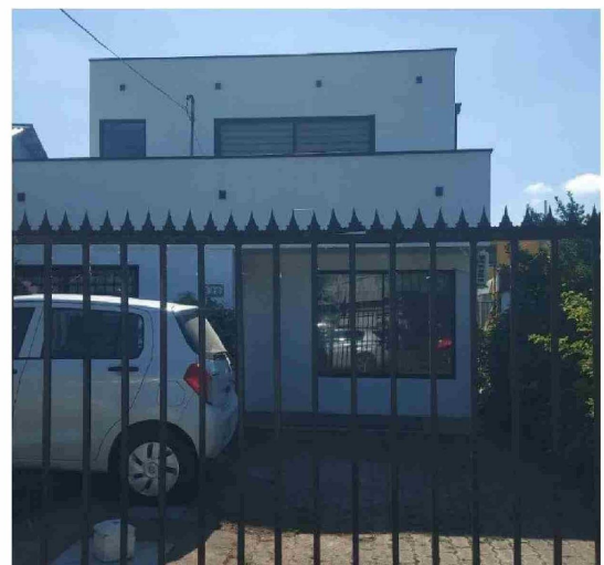
EN UNA VIVIENDA ARRENDADA se realizan las clases en la Universidad La República.

El rector concluyó asegurando que la situación ha sido comunicada oportunamente a funcionarios, docentes y estudiantes.