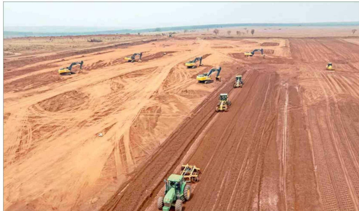
La firma chilena comenzó los movimientos de tierra en Brasil para la construcción del Proyecto Sucuriú, que tendrá una planta con capacidad de producción anual de 3,5 millones de toneladas de celulosa.