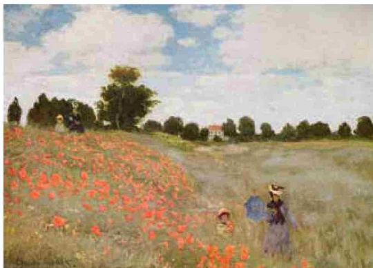
« Coquelicots » (1873), Claude Monet.