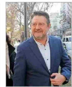
Gobierno regional suscribió contrato con fundación investigada.

REFORMA AL SISTEMA DE NOMBRAMIENTOS INGRESA HOY: MINISTERIO DE JUSTICIA PROPONDRÁ CONSEJO PERMANENTE DE CINCO MIEMBROS Y MANTENER LOS CUPOS DE SUPREMOS "EXTERNOS" | C 2