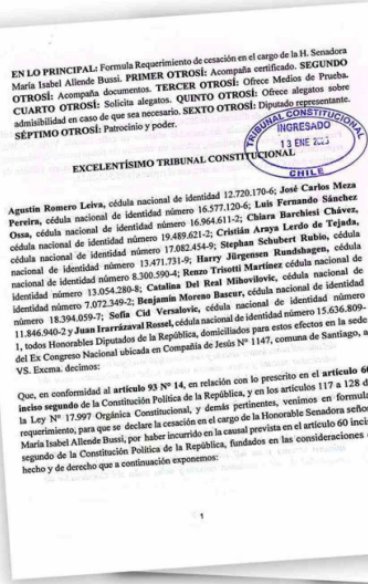
Parte del requerimiento de los diputados republicanos.

Al respecto, los parlamentarios republicanos señalan a través del documento presentado al TC que "conforme el Derecho Público Chileno, la causal que hemos invocado (artículo 60) debe ser interpretada de manera estricta, es decir, no cabe hacer interpretaciones que la hagan