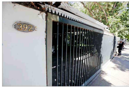
El inmueble cuya venta está en cuestión, ubicado en Providencia.

más extensiva de lo que el propio constituyente consideró".