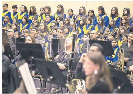
Diferentes piezas clásicas conformaron el repertorio del evento.

La actividad contó con la presencia de más de 500 asistentes, principalmente compuestos por apoderados y las familias de los estudiantes, socios de la corporación, funcionarios y autoridades de COEMCO, quienes se deleitaron con la presentación de