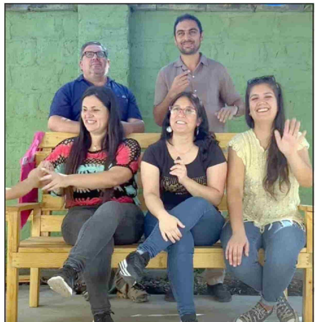
Organizadores de la actividad cultural.