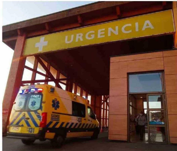
DOS VECES LLEGÓ AL SERVICIO DE URGENCIA LA PACIENTE ADULTA MAYOR. LA SEGUNDA VEZ FALLECIÓ EN LA UNIDAD.

"Es importante señalar que como hospital somos conscientes de la necesidad de mejorar nuestros tiempos de espera en la Unidad de Urgencia y para esto estamos realizando permanentes esfuerzos a nivel de toda la institución. Es nuestra meta y compromiso alcanzar los estándares de salud que nuestros pacientes necesitan, por lo que seguiremos trabajando", se expone en el documento del recinto puertomon-