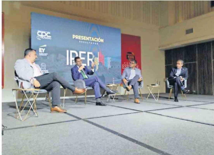
Los resultados del IPER fueron presentados ayer por la UNAB, CPC Biobío y consultora EY.

Si bien para 2025 se percibe cierto pesimismo en torno a las inversiones, Fuentes advirtió que hay expectativas en las contrataciones en las empresas para este año y también en la remuneración sobre IPC. "Respecto del crecimiento país para el presente año, cerca del 85% de los encuestados estima que éste estará en el rango estimado por el Banco Central, esto es, entre 1,5% y 2,5%, lo que demuestra que el IPER están en sintonía con las proyecciones de indicadores nacionales y la mirada del empresariado regional", detalló el académico.