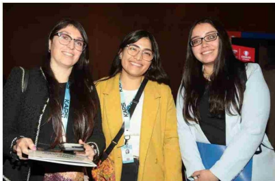
Estudiantes de INACAP.