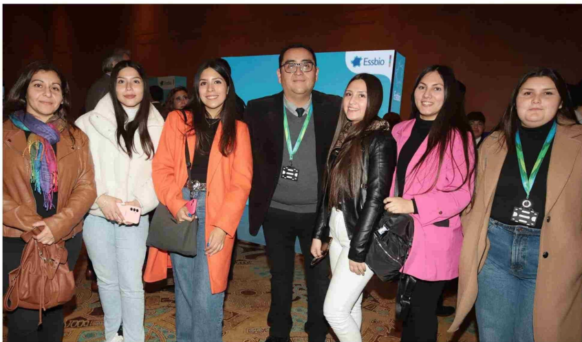
Estudiantes y representantes de Santo Tomás Rancagua.