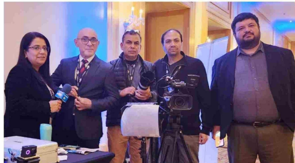
Estudiantes de INACAP.