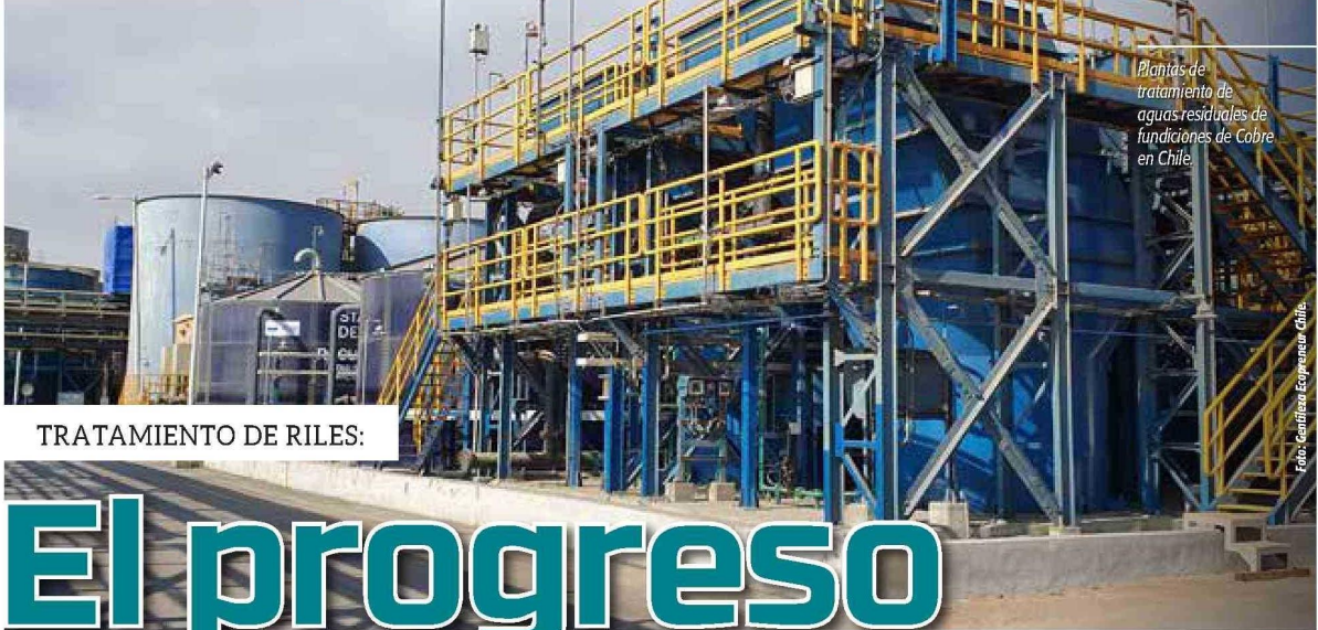
Plantas de tratamiento de aguas residuales de fundiciones de Cobre en Chile.