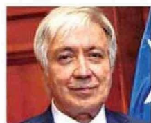
Ministro Mauricio Silva Cancino

● Ministro de la Corte Suprema desde el año 2017. Ingresó al máximo tribunal en el cupo de abogado externo.