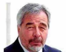
Ministro Gabriel Ascencio Mansilla

● Ministra de la Corte Suprema desde el año 2022. Fue directora de la Escuela de Postgrado de Derecho de U. de Chile.