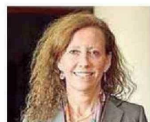
Ministra María Gajardo Harboe

● Ministro de la Corte Suprema desde el año 2019. Antes fue ministro de la Corte de Apelaciones de Santiago.