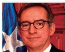
Ministro Arturo Prado Puga

● Asumió como ministro de la Corte Suprema el año 2005. Siendo propuesto por el ex Presidente Ricardo Lagos.