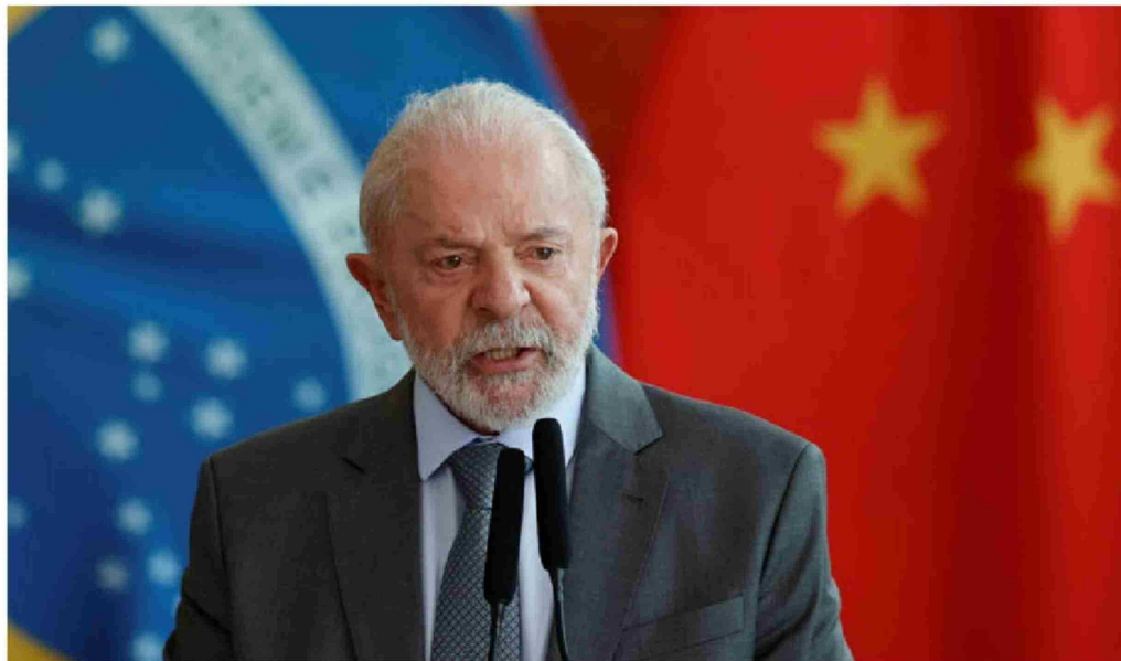
► El presidente de Brasil, Luiz Inácio Lula da Silva, en Brasilia, el 20 de noviembre de 2024.

este último era el auxiliar directo de Jair Bolsonaro. Y una de las reuniones, la más importante, que fue grabada, fue realizada en el Palacio del Planalto en 2022, en noviembre, cuando Bolsonaro estaba en el Palacio y era todavía el presidente del país, después de la elección. Entonces, todas las conexiones muestran que Jair Bolsonaro era parte de este golpe, pero también que no eran acciones aisladas, sino que son muy programadas. Hay algo de patético en los nombres que ellos usaron para la operación: puñal verde amarelo, etc., pero lo patético puede ser político, ¿no? Sabemos que las últimas elecciones presidenciales de Brasil fueron muy reñidas, y que el país está dividido entre el nordeste y el sur, principalmente. El nordeste más de la izquierda, el sur más de la derecha radical. El Senado y la Cámara están muy, muy a la derecha, por lo que Lula tiene muchos problemas para gobernar y ahora mismo tuvimos las elecciones para alcalde, y la centroderecha mostró mucha fuerza. Entonces es un momento muy sensible de la historia de Brasil.