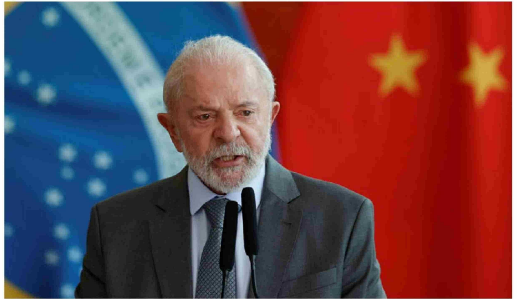
► El presidente de Brasil, Luiz Inácio Lula da Silva, en Brasilia, el 20 de noviembre de 2024.

este último era el auxiliar directo de Jair Bolsonaro. Y una de las reuniones, la más importante, que fue grabada, fue realizada en el Palacio del Planalto en 2022, en noviembre, cuando Bolsonaro estaba en el Palacio y era todavía el presidente del país, después de la elección. Entonces, todas las conexiones muestran que Jair Bolsonaro era parte de este golpe, pero también que no eran acciones aisladas, sino que son muy programadas. Hay algo de patético en los nombres que ellos usaron para la operación: puñal verde amarelo, etc., pero lo patético puede ser político, ¿no? Sabemos que las últimas elecciones presidenciales de Brasil fueron muy reñidas, y que el país está dividido entre el nordeste y el sur, principalmente. El nordeste más de la izquierda, el sur más de la derecha radical. El Senado y la Cámara están muy, muy a la derecha, por lo que Lula tiene muchos problemas para gobernar y ahora mismo tuvimos las elecciones para alcalde, y la centroderecha mostró mucha fuerza. Entonces es un momento muy sensible de la historia de Brasil.