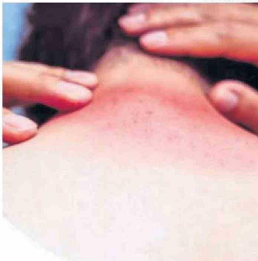
EL LLAMADO ES PREVENIR QUEMADURAS.