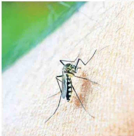
PICADURAS DE INSECTOS Y ARÁCNIDOS SON CASOS DE CONSULTA.