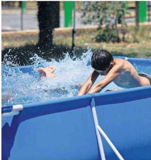
INFECCIONES Y ASFIXIAS POR INMERSIÓN AUMENTAN EN VERANO.