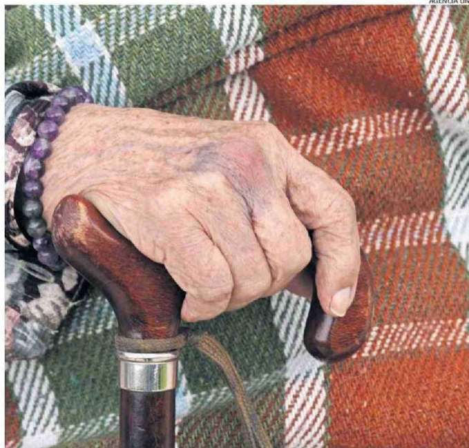
UN FACTOR CRÍTICO ES LA SALUD DENTAL Y VISUAL DE ADULTOS MAYORES: MUCHOS NO PUEDEN LEER ETIQUETAS.

mentaria se refiere a "la disponibilidad limitada o incierta de alimentos por factores sociodemográficos, ingreso económico, conocimientos y habilidades nutricionales, cercanía con lugares de abastecimiento, red de apoyo y otros".