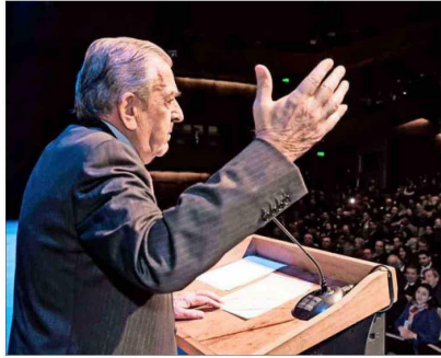
El expresidente Eduardo Frei Ruiz-Tagle afirmó que "la industria del salmón ha sido el motor del crecimiento del sur de Chile en los últimos 30 años".

Con una masiva concurrencia, y la visión de distintos expositores nacionales sobre la relevancia de la salmonicultura y su aporte para el desarrollo del país, cerró la primera versión del "Salmón Summit 2024: Potenciando la salmonicultura chilena al 2050", organizado por SalmonChile. La instancia reunió a empresarios, líderes gremiales, la sociedad civil y la comunidad para debatir sobre los principales desafíos del sector productivo hacia los próximos años.