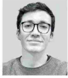
Por Joaquín Sierpe Economista de Pivotes