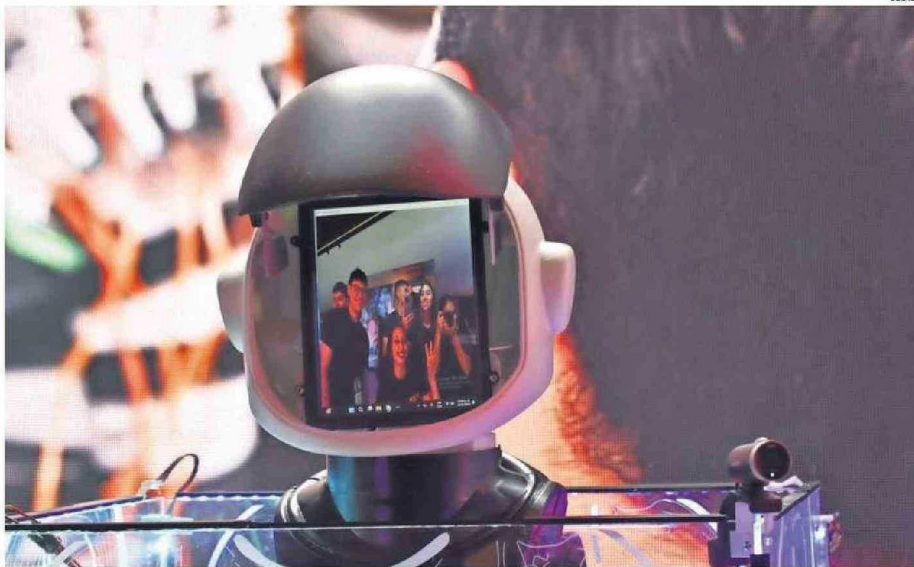
LA CABEZA DE STELARBOT YA ESTÁ LISTA Y SE EXHIBIÓ EN CONGRESO FUTURO 2025. EN EL CASCO SE VERÁ EL ROSTRO DEL USUARIO.