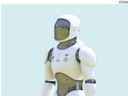
ASÍ LUCIRÁ EL ROBOT UNA VEZ TERMINADO. SE MOVERÁ CON RUEDAS.