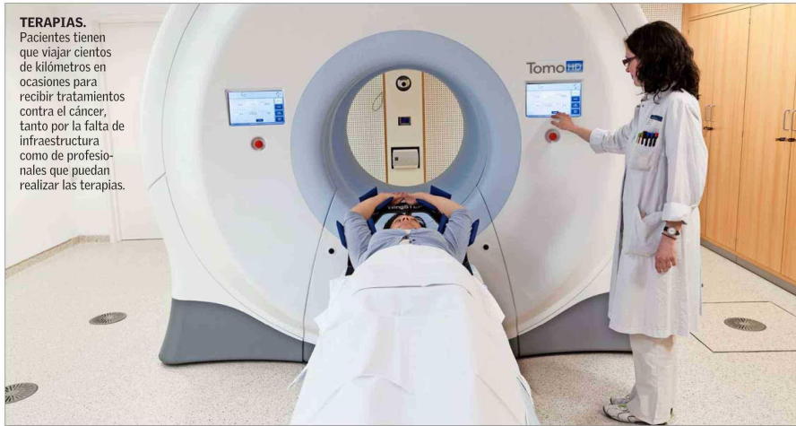
TERAPIAS. Pacientes tienen que viajar cientos de kilómetros en ocasiones para recibir tratamientos contra el cáncer, tanto por la falta de infraestructura como de profesionales que puedan realizar las terapias.