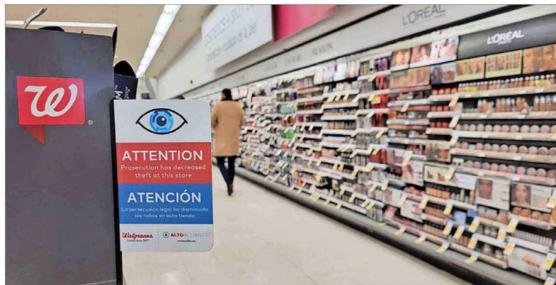
La firma opera con una sede en Miami, y cuenta con presencia en 28 estados de EE.UU., incluyendo Puerto Rico y Washington, sumando más de 50 ciudades, entre las que destacan Nueva York, Chicago, Los Ángeles y San Francisco.

Tras ingresar al mercado americano en 2016, el holding experto en seguridad opera con firmas de la talla de Walgreens, CVS, WholeFoods y Target. No obstante, su fundador relata que su arremetida en este negocio no fue fácil.