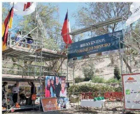
En el campus histórico de la Universidad de Atacama está la feria.