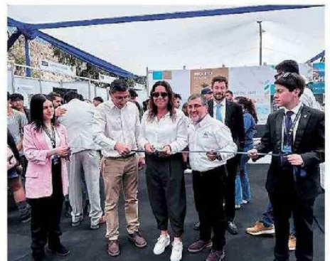
Durante la inauguración.