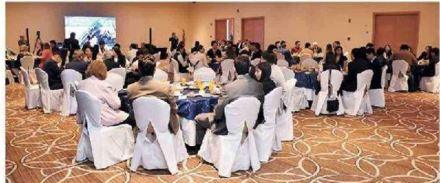
El desayuno se realizó en los salones de Casino y Hotel Antay.

Precisamente, una de las características distintivas del Coloquio Minero es que los estudiantes no son solo espectadores, sino que participan en toda la organización previa al evento y están en el centro del mismo. De hecho, varios