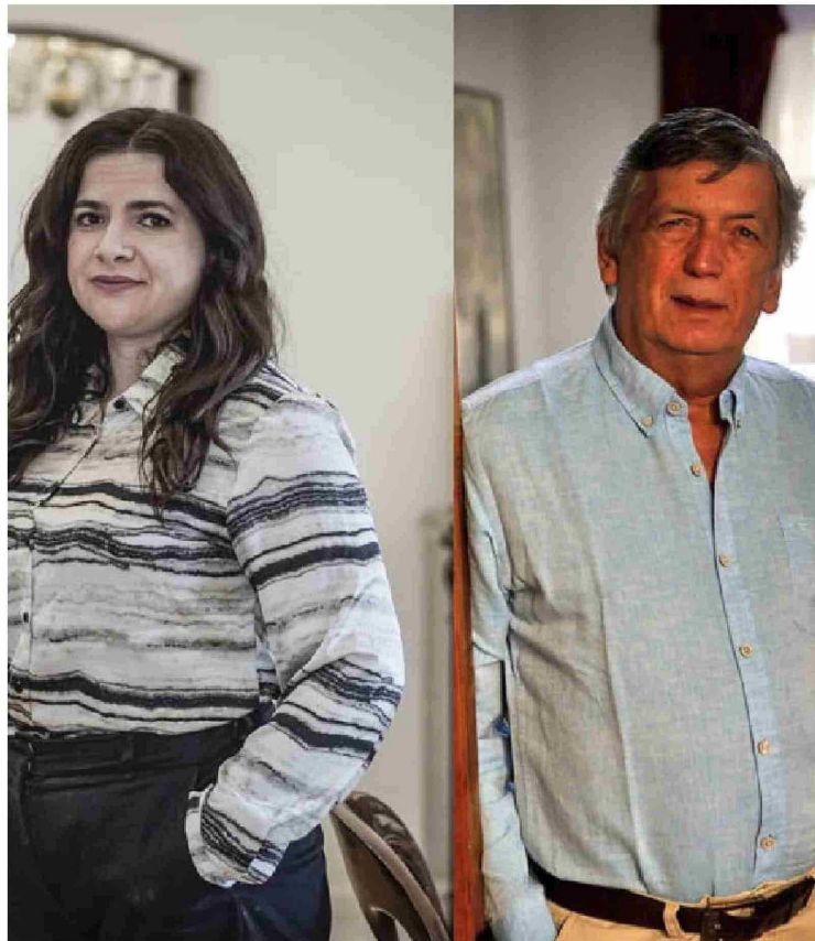
► La ministra de la Mujer y Equidad de Género, Antonia Orellana, y el presidente del Partido Comunista, Lautaro Carmona.

Las diferencias volvieron a reflotar tras las elecciones venezolanas del pasado 28 de julio, que culminaron con la proclamación de Nicolás Maduro como vencedor -aunque sin actas transparentadas-. Desde entonces, el Frente Amplio se ha alineado fielmente con la postura del Presidente Gabriel Boric, quien no ha reconocido el resultado y ha exigido que se transparenten las ac-