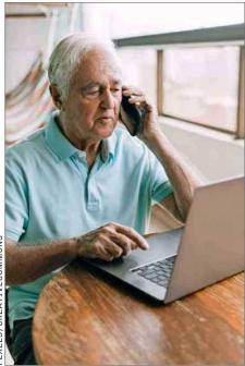
Las llamadas telefónicas son la segunda preferencia para comunicarse; WhatsApp está en primer lugar.

Y añade: “Estamos trabajando para incluir contenido sobre la prevención de fraudes cibernéticos, análisis crítico de la información y navegación segura en internet”.